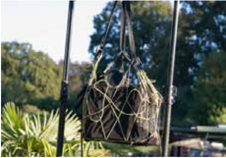
PERFORMANCE : «L'HOMME ASSIS DANS LE COULOIR» / DURAS GRÜ GENÈVE