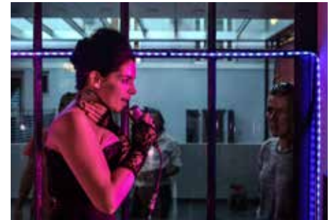
CRÉATION : «TRAGEDY RELOADED, PRÉLUDE II» / ESCHYLE & JELINEK FLUX LABORATORY CAROUGE & TOURNÉE