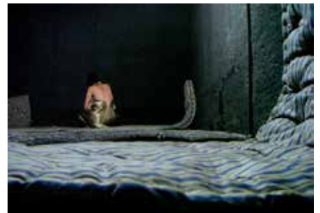
CRÉATION : «JOCASTE» / FABIEN T50 GENEVE