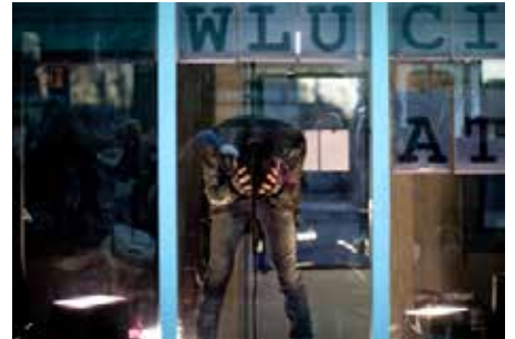
HAPPENING : «HOWLUCINATION» / GINSBERG ESPACE URBAIN, ZABRISKI POINT GENÈVE & TOURNÉE