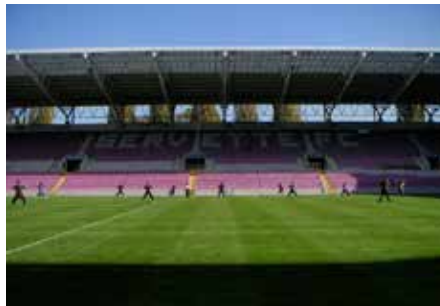
CRÉATION : «HUNGER ! RICHARD III» / SHAKESPEARE LA COMEDIE DE GENEVE