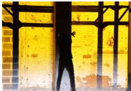
RE-CRÉATION : «HOWL» / GINSBERG FESTIVAL CABARET DE CURIOSITÉ, AULNOYE-AYMÉRIES (FR)