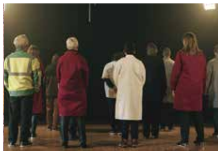
RÉALISATION FILM : «FLIRT(S)» / BÖSCH TOURNÉ EN HAUTS-DE-FRANCE