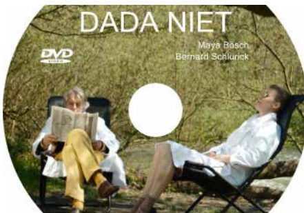
PERFORMANCE ET FILM : «DADA NIET» / SCHLURICK & BÖSCH FLUX LABORATORY GENEVE & ZURICH