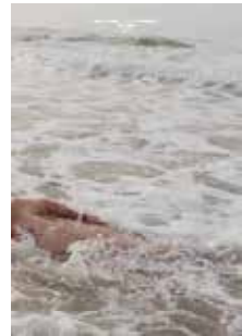
PUBLICATION, QUATRIÈME NUMÉRO : «ON TIME» - ISBN 978-2-9700949-3-7