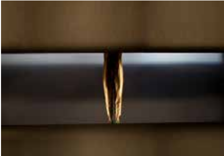
CRÉATION : «SCHREIB MIR DAS LIED VOM TOD» / MORRICONE & MÜLLER ARSENIC LAUSANNE & TOURNÉE