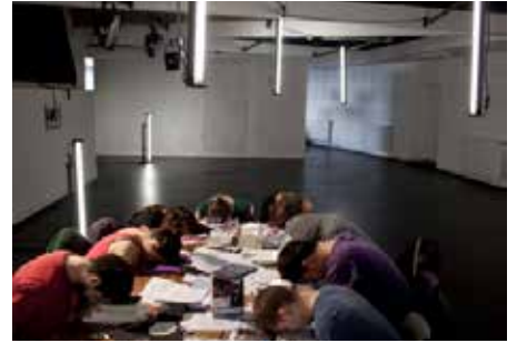
WORKSHOP : «THE BEAT GENERATION» THÉÂTRE NATIONAL DE BRETAGNE, RENNES