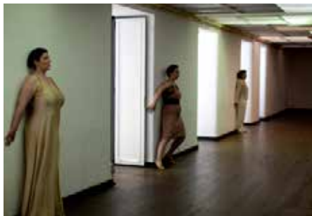
CRÉATION «A STATEMENT ON BODY, SOUND, SPACE & TIME» D'APRÈS FRANZ SCHUBERT, GRÜ GENÈVE