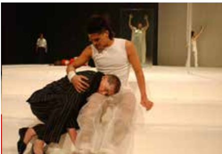
CRÉATION : «GENEVA.LOUNGING» / BERTHOLET LA COMÉDIE DE GENEVE