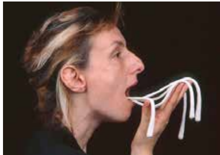
CRÉATION : «CRAVE (MANQUE)» / KANE LE GALPON GENEVE