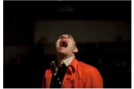
PERFORMANCE : «EXPLOSION» / KIREZ BLACK BOX GRÜ GENÈVE