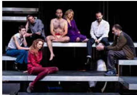
CRÉATION : PIÈCES DE GUERRE EN SUISSE / RYCHNER VIDY-LAUSANNE & TOURNÉE