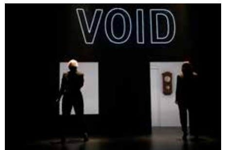
CRÉATION : «CONCERT À LA CARTE» / KROETZ LE POCHÉ / GVE, SUISSE