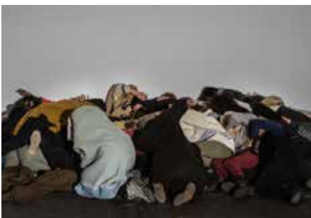
PERFORMANCE : «LA FORÊT D'O» / AVEC CENT CITOYEN.NE.S LE COMMUN, BÂTIMENT D'ART CONTEMPORAIN - GENEVE