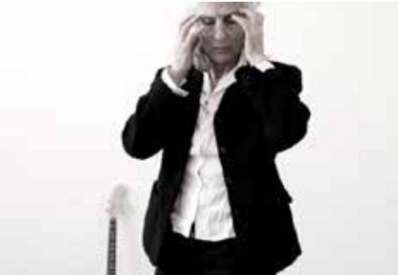
PERFORMANCE : «HOWL» / GINSBERG MAMCO, MUSÉE D'ART MODERNE ET CONTEMPORAIN GENÈVE