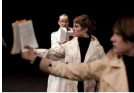
CRÉATION : «DRAMES DE PRINCESSES» / JELINEK LA COMÉDIE DE GENÈVE & TOURNÉE