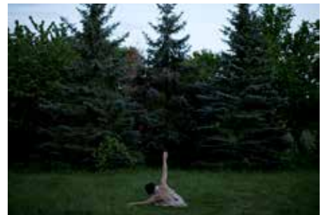
CRÉATION : «TOPOGRAPHIE DÉSIRS» / JELINEK, PLATH, MEINHOF... MAISON UTOPIANA GENÈVE