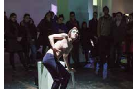
CRÉATION «TRAGEDY RELOADED, PRÉLUDE I» / JELINEK FESTIVAL ELECTRON LE COMMUN GENEVE & TOURNÉE