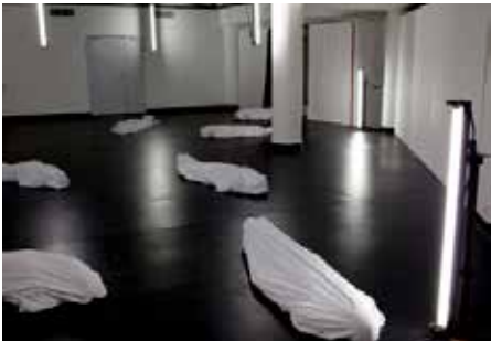
CRÉATION : «HAMLETMASCHINE» / MÜLLER UNTERFÜHRUNG ESCHER WYSS ZÜRICH