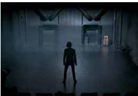
TOURNÉE : «HOWL» / GINSBERG THÉÂTRE DU GRÜTLI & TOURNÉE