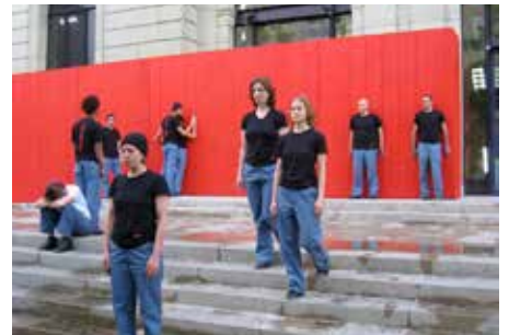
CRÉATION COLLECTIVE «INFERNO» / DANTE GRÜ TRANSTHEATRE GENEVE