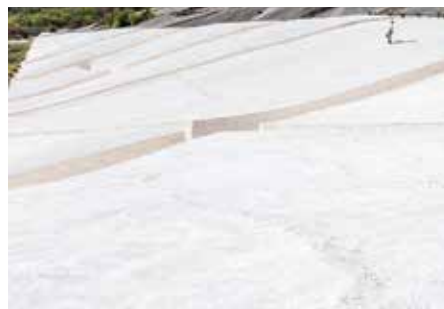
RÉALISATION FILM : «RISS / FÉLURE / CREPA» / BÖSCH TOURNÉ À GIBELLINA EN SICILE