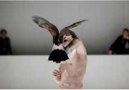
CRÉATION : «SOUTERRAINBLUES» / HANDKE BLACK BOX GRÜ GENÈVE