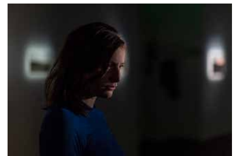
INSTALLATION PLURIDISCIPLINAIRE : «EXPLOSION OF MEMORIES» / BÖSCH LE COMMUN & CENTRE DE LA PHOTO GENEVE