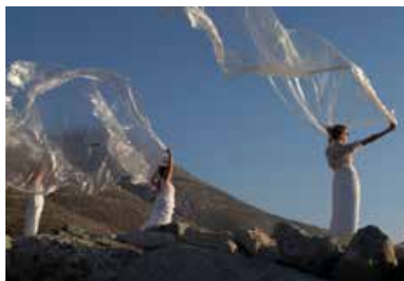
PERFORMANCE : «LA FORÊT D'O» / HAPPENING PORT AEGIALI, AMORGOS, GRÈCE