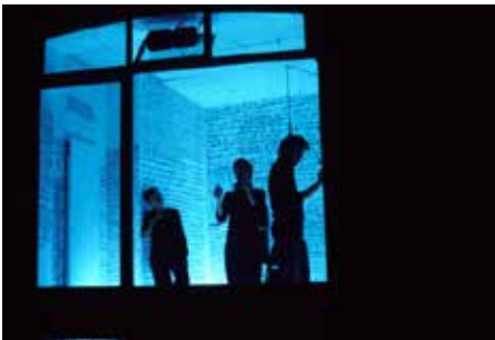
HAPPENING : «LUI PAS COMME LUI» / JELINEK T50 GENEVE & TOURNÉE