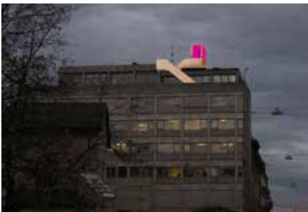
CRÉATION / INSTALLATION : «STATIONS URBAINES : EIN SPORTSTÜCK» / JELINEK SUR LE TOIT DU THÉÂTRE SAINT-GERVAIS & TOURNÉE