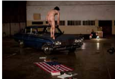
CRÉATION : «HOPE, HOWL» / GINSBERG BIENNALE CHARLEROI-DANSES (BE) & TOURNÉE