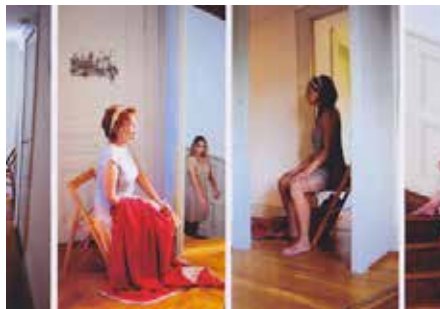
PERFORMANCE, HAPPENING : «ELEKTRATEXT» / MÜLLER VILLA BERNASCONI GRAND-LANCY