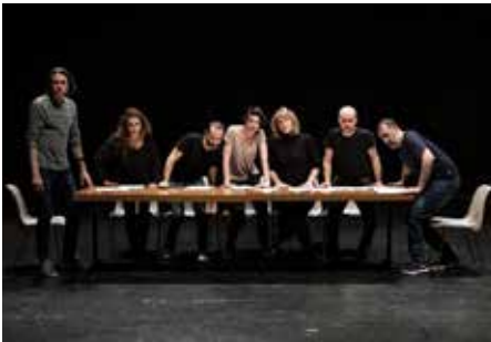
MISE EN ESPACE : PIÈCES DE GUERRE EN SUISSE THÉÂTRE OUVERT ET CENTRE CULTUREL SUISSE (CCS) PARIS