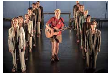
SPECTACLE DE SORTIE, HETSr MANUFACTURE-LAUSANNE : «SUR LA VOIE ROYALE» / JELINEK FESTIVAL SUPER VIA, SCULFORT, MANÈGE MAUBEUGE