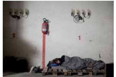
MISE EN LECTURE : «VOLEUR DE VIE» / PETR LA COMÉDIE DE GENEVE