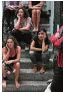
PUBLICATION, DEUXIÈME NUMÉRO : «ON BODY» - ISBN 978-2-9700949-1-3