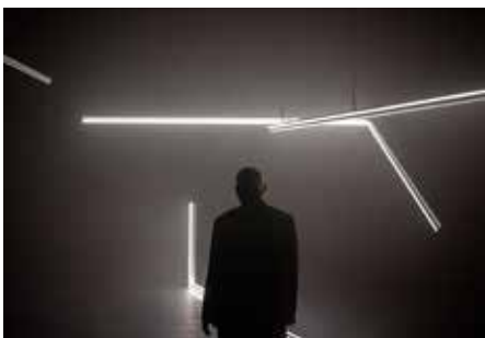
CRÉATION : «MANUEL D'EXIL» / COLIC THÉÂTRE ST GERVAIS GENEVE & TOURNÉE