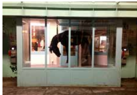
HAPPENING : «CHEVAL DE BATAILLE» / BÖSCH & GOLAY ZABRISKI POINT, GENÈVE