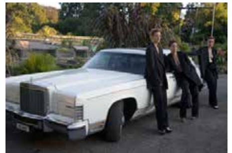
CRÉATION : «WET !» / JELINEK THEATRE DE L'ORANGERIE GENEVE & TOURNÉE